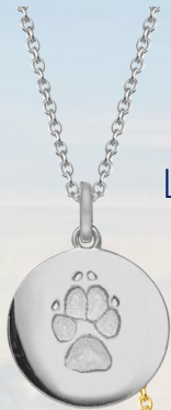
LM1401WP (925 Silber)