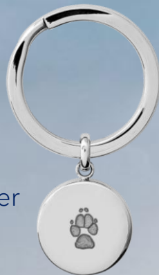
LM1122WP Inkl. Aschebehälter (Edelstahl)

Personalisierter Andenkenschmuck mit der Pfote von Ihrem Tier Ketten haben eine Länge von 50cm Bitte Kennnummer angeben Lieferzeit ca. 14 Tage