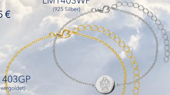
LM1403GP (18k vergoldet)