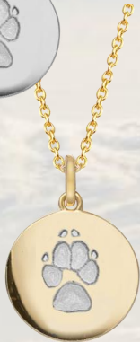
LM1401GP (18k vergoldet)