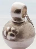
Fini mit Pfote